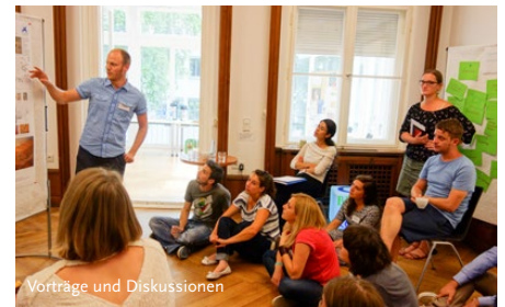
Vorträge und Diskussionen