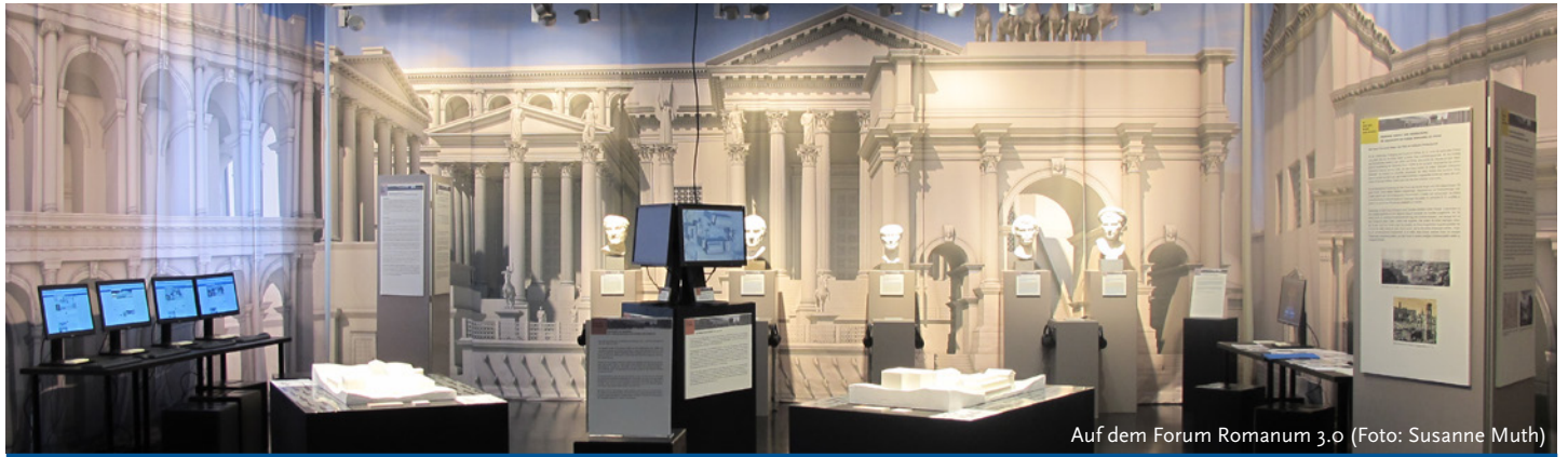
Auf dem Forum Romanum 3.0

Neuer Standort für die ‚Kleinen Fächer‘ an der Freien Universität