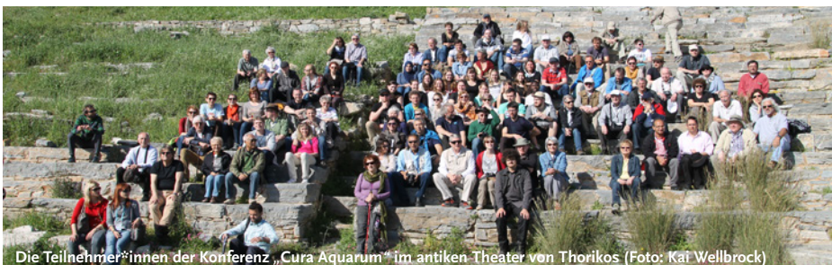
Die Teilnehmer*innen der Konferenz „Cura Aquarum“ im antiken Theater von Thorikos