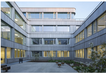
Der noch nicht ganz offizielle Spitzname Holzlaube für den Neubau kommt nicht von ungefähr: Der Entwurf des Münchner Architekten Florian Nagler entspricht neuesten ökologischen Standards und besticht durch eine angenehme ein- bis dreigeschossigen Gebäudeaufteilung, gerundete Gebäudekanten und einer lichtdurchlässigen Fassade mit natürlich vergrauter Holzverkleidung.

■ Buchtip: Simone Ladwig-Winters, Großes Haus für kleine Fächer. Von der Villenkultur zum neuen Campus der Freien Universität. Zu beziehen über die Pressestelle der Freien Universität Berlin: presse@fu-berlin.de