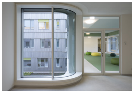
Neben mehreren Innenhöfen (s.links) laden auch die hellen Flure und ausgewiesenen Aufenthaltsbereiche zum Verweilen und Begegnen ein, damit der in den Villen gepflegte enge Kontakt von Studierenden untereinander sowie mit den Dozentinnen und Dozenten auch im Neubau nicht abbricht.