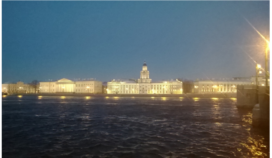
Die Universität St. Petersburg an einem Montag morgen um 09:30 Uhr. Richtig hell wird es hier erst gegen Mittag

Der erste Schritt zu dieser Kooperation war nun der gemeinsam durchgeführte Workshop im Dezember zu Datierungsprinzipien in den Altertumswissenschaften. 18 Wissenschaftlerinnen und Wissenschaftler aus Berlin, Göttingen, Köln, St. Petersburg und Novosibirsk stellten Ideen und Ansätze zu diesem Thema vor, das in den archäologischen Wissenschaften seit jeher herausragende Bedeutung hat. Die Präsentationen umfassten sowohl Zeitkonzepte in verschiedenen historischen Epochen als auch archäologische Datierungsmethoden – naturwissenschaftliche und archäologisch-historische Ansätze und durch sie erzielte aktuelle Ergebnisse. Der zeitliche Rahmen war zwischen Jungsteinzeit und Mittelalter sogar weiter gespannt als der Veranstaltungstitel es angekündigt hatte, und geografisch wurde praktisch der gesamte eurasische Raum erfasst.