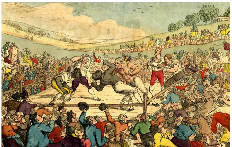
Thomas Rowlandson, Rural Sports - A Milling Match (1811).