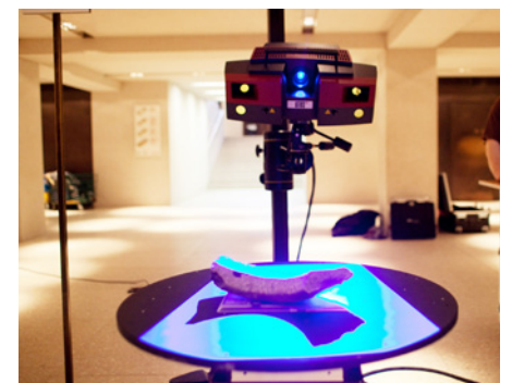
Gerd Graßhoff beim 3-D-Scan von Marmorfragmenten im Neuen Museum Berlin