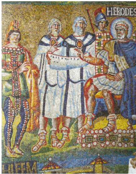
Herodes empfängt die Heiligen Drei Könige, Mosaik, Santa Maria Maggiore, Rom

Unsere Tagung am 18./19. Februar möchte dieses so wichtige Instrument römischer Herrschaft untersuchen, Vor- und Nachteile herausarbeiten, und zwar sowohl aus der regionalen (18. Februar) wie aus der zentralen (19. Februar) Perspektive. Die Vortragenden haben zu ihren Regionen bzw. zur römischen Herrschaftspolitik intensiv geforscht, so daß konkrete Ergebnisse erhofft werden können.