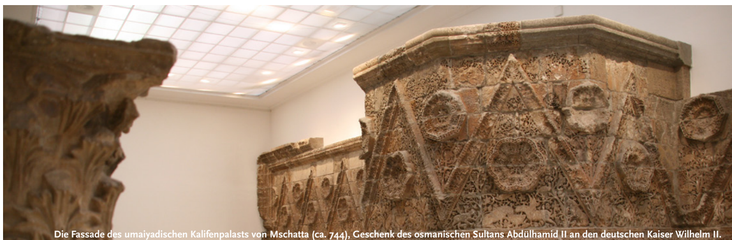
Die Fassade des umayyadischen Kalifenpalasts von Mshatta (ca. 744), Geschenk des osmanischen Sultans Abdülhamid II an den deutschen Kaiser Wilhelm II.

01.02.2010 - 31.10.2010 | FU | B-I-2 The ancient necropoleis of Zeugma and funerary steles