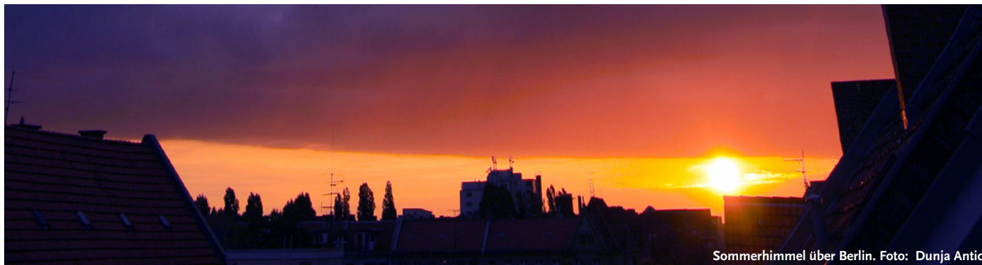
Sommerhimmel über Berlin.

Liebe Leserin, lieber Leser, liebe Kolleginnen und Kollegen,