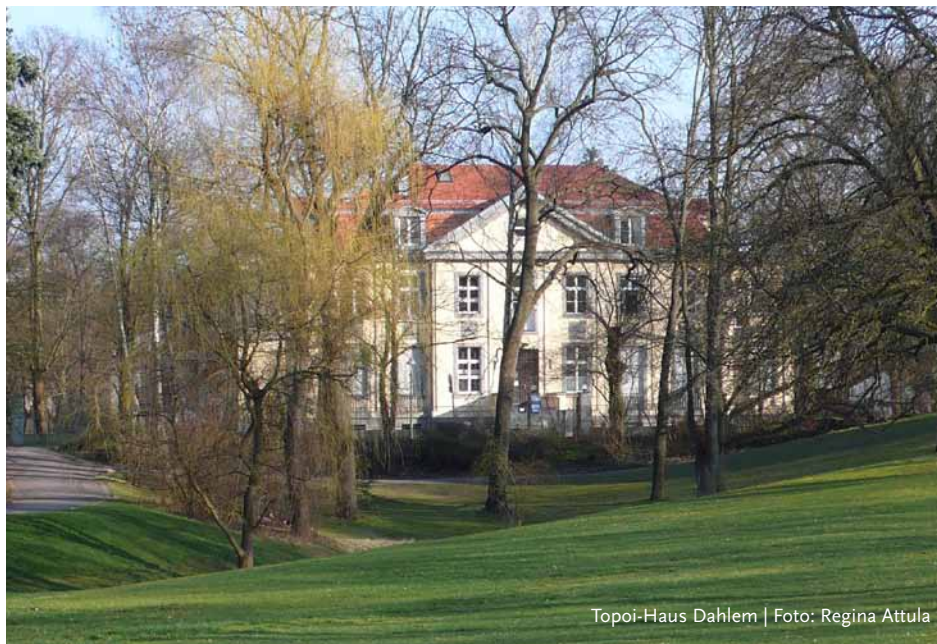
Topoi-Haus Dahlem

15.09.2009 – 15.12.2009 | HU | D Scientific method and spatial concepts in antiquity