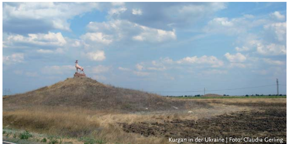
Kurgan in der Ukraine