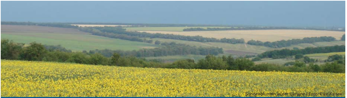
Sonnenblumen in der Ukraine

Liebe Leserin, lieber Leser, liebe Kolleginnen und Kollegen,