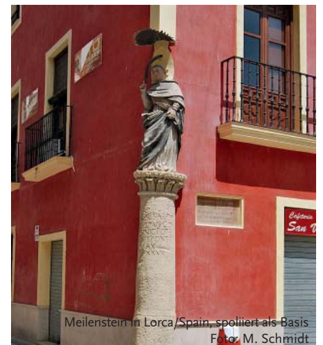
Meilenstein in Lorca/Spain, spoliert als Basis