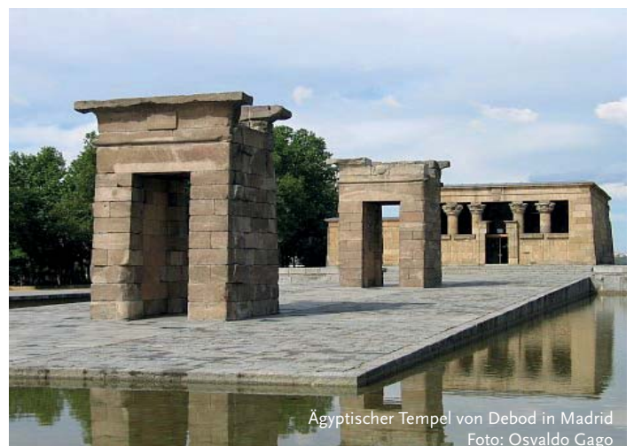
Ägyptischer Tempel von Debed in Madrid